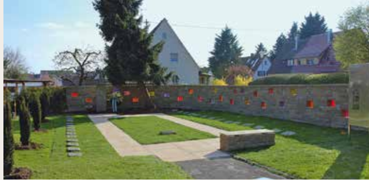
Gedenkstätte im Friedhof

Die Gedenkstätten auf dem Friedhof sowie beim "Henkersteinbruch" wurden 2015 anlässlich des 70. Jahrestags der Räumung des KZ Welzheim um- bzw. neu gestaltet und am Standort des ehemaligen KZ wurde eine Gedenk- und Informationstafel aufgestellt.